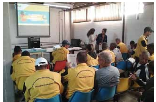
Professores do Projeto Tigrinho recebem capacitação do Cidade Responsável.