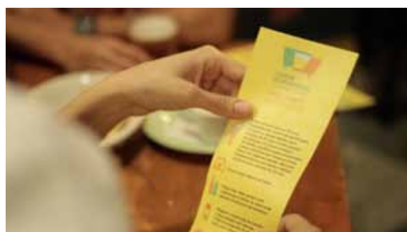
Material do Cidade Responsável fala sobre consumo consciente de bebidas alcólicas.