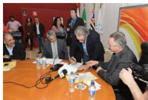
Sindicatos que apoiam o Cidade Responsável assinaram manifesto em prol da nova lei.

Aprovada sem vetos pela presidente Dilma Rousseff, a lei que criminaliza a venda e distribuição de bebidas alcoólicas a menores de 18 anos está em vigor desde o dia 18 de março. A medida altera o artigo 203 do estatuto da Criança e do Adolescente para criminalizar as condutas de "vender, fornecer, servir, ministrar ou entregar, ainda que gratuitamente, de qualquer forma, a criança ou a adolescente, bebida alcoólica". E ainda revogou o inciso I do artigo 63 do Decreto-Lei nº 3.688/41 - Lei das contravenções penais. A partir deste ano, o ato será tido como crime com pena de detenção, de dois a quatro anos, e multa de R$ 3 mil a R$ 10 mil reais. Como medida administrativa, a Lei 13.106/15 prevê a interdição do estabelecimento comercial infrator até o recolhimento da multa aplicada.