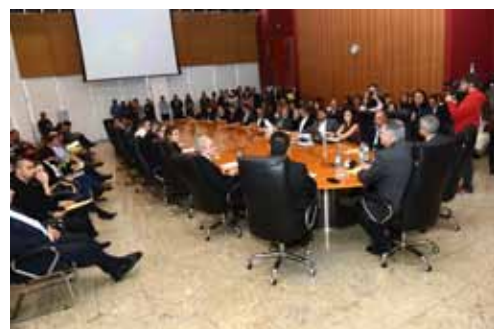
Evento foi realizado no salão nobre da prefeitura.