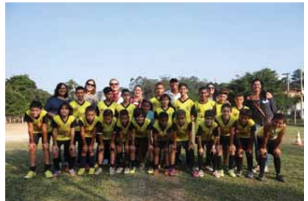
Turma do Bairro dos Finco.

O Projeto Cidade Responsável também foi apresentado ao Projeto Tigrinho, com a presença dos monitores das escolas de futebol do programa esportivo social - uma parceria entre a Prefeitura e o São Bernardo Futebol Clube. O Projeto Tigrinho é um projeto esportivo social realizado através de uma parceria entre o São Bernardo Futebol Clube, a Fábrica do Futuro e a Prefeitura Municipal de São Bernardo do Campo distribuídas entre os campos/escolas do nosso município e também presente em Diadema, São Sebastião e Açucena-MG.