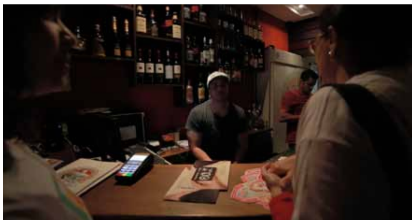
Dono de estabelecimento na Kennedy recebe material do Cidade Responsável.

Foram distribuídos cartazes, folders explicativos sobre a importância de consumir álcool com moderação, a importância da proibição da bebida alcoólica aos menores de 18 anos, além de comportamentos em prol do bem público e da sociedade.