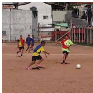
Alunos do Projeto Tigrinho da Vila São José.

O Projeto Cidade Responsável também foi apresentado ao Projeto Tigrinho, com a presença dos monitores das escolas de futebol do programa esportivo social - uma parceria entre a Prefeitura e o São Bernardo Futebol Clube. O Projeto Tigrinho é um projeto esportivo social realizado através de uma parceria entre o São Bernardo Futebol Clube, a Fábrica do Futuro e a Prefeitura Municipal de São Bernardo do Campo distribuídas entre os campos/escolas do nosso município e também presente em Diadema, São Sebastião e Açucena-MG.