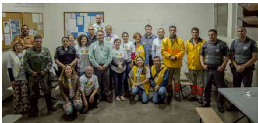
Equipe da prefeitura, CervBrasil e demais órgãos públicos se reúnem antes da ação na Kennedy.

Durante a noite as equipes do Cidade Responsável e da prefeitura - além de órgãos públicos como Vigilância Sanitária, Guarda Municipal, Procon, Polícia Militar, entre outros, e de entidades sindicais que apoiam o projeto - visitaram 33 estabelecimentos na região divulgando as principais ações em prol do consumo responsável